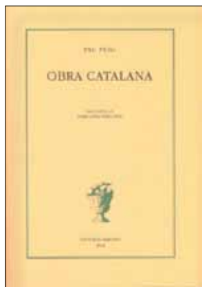
Pau Puig, Obra catalana , Editorial Barcino, Barcelona 2012.

E l llibre Obra catalana de Pau Puig és l'últim volum d'Editorial Barcino publicat dins la col·lecció «Biblioteca Baró de Maldá».