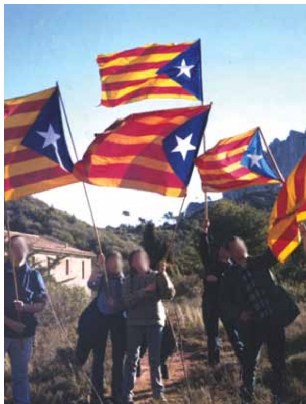
Joves mostrant l'estelada vora Montserrat

La bandera de l'estel solitari, ideada per Vicenç A. Ballester i adoptada per Macià, rep sovint el nom de bandera d'Estat Català. Es tracta d'una ensinya de combat, que visualitza la necessitat de la lluita per a l'alliberament nacional, mentre la senyera és la bandera històrica i legítima de Catalunya. Això indica una fragmentació del catalanisme polític, que deixa de tenir una sola bandera. L'estelada presenta una influència evident de la bandera cubana, que s'inspirà en la nord-americana —especialment la texana. També és gran la similitud amb la bandera de Puerto Rico, més semblant encara a la nord-americana