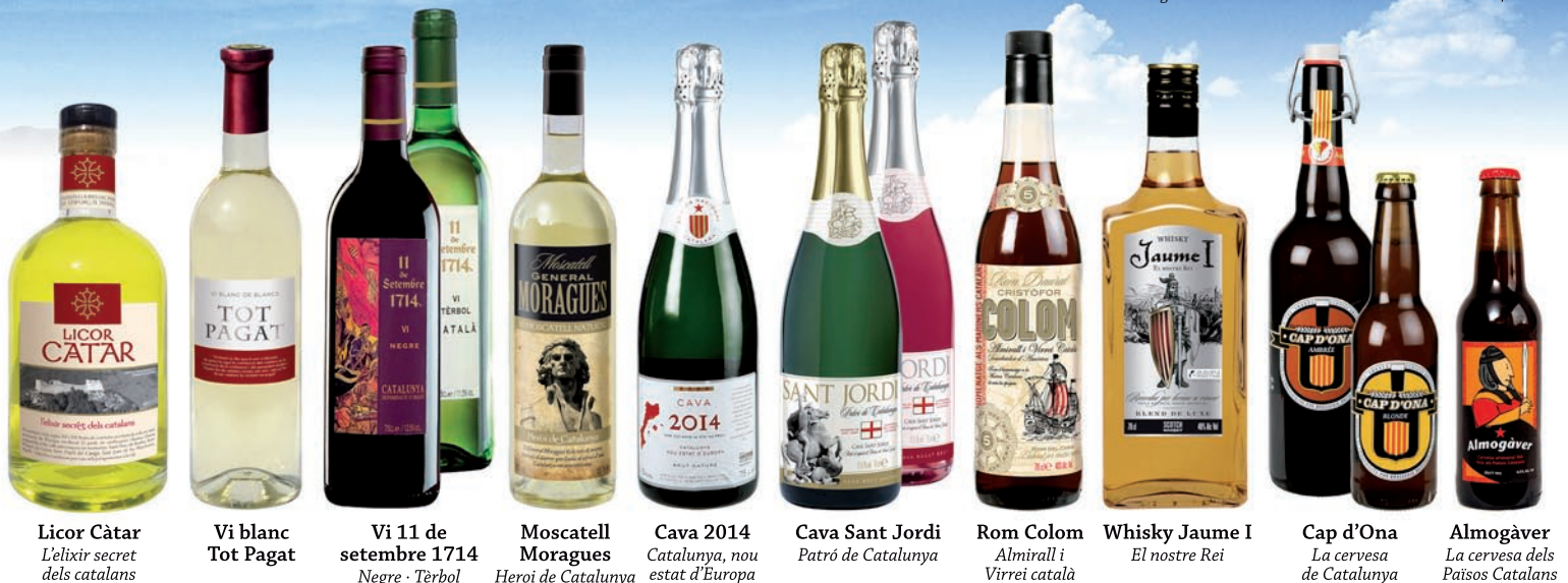
Licor Càtar L'elixir secret dels catalans