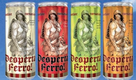
Desperta Ferro! Energètic Cola Catalana Tè verd i llimona Sucmulti-fruïtes