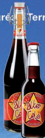
Cola Catalana Cola Lliure!

Localitza l'establiment Xecna més proper al teu domicili a: www.xecna.cat Tel. 93 866 07 45 info@apats.cat