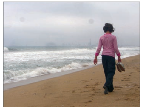
Camina tota sola

« sola iaces viduo cubili (OVIDI) = jeus tota sola en el llit solitari » (Dicc. llatí-català, s.v. solus -a -um ); també podríem dir jeus sola en el llit solitari .