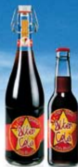
Cola Catalana Cola Lliure!