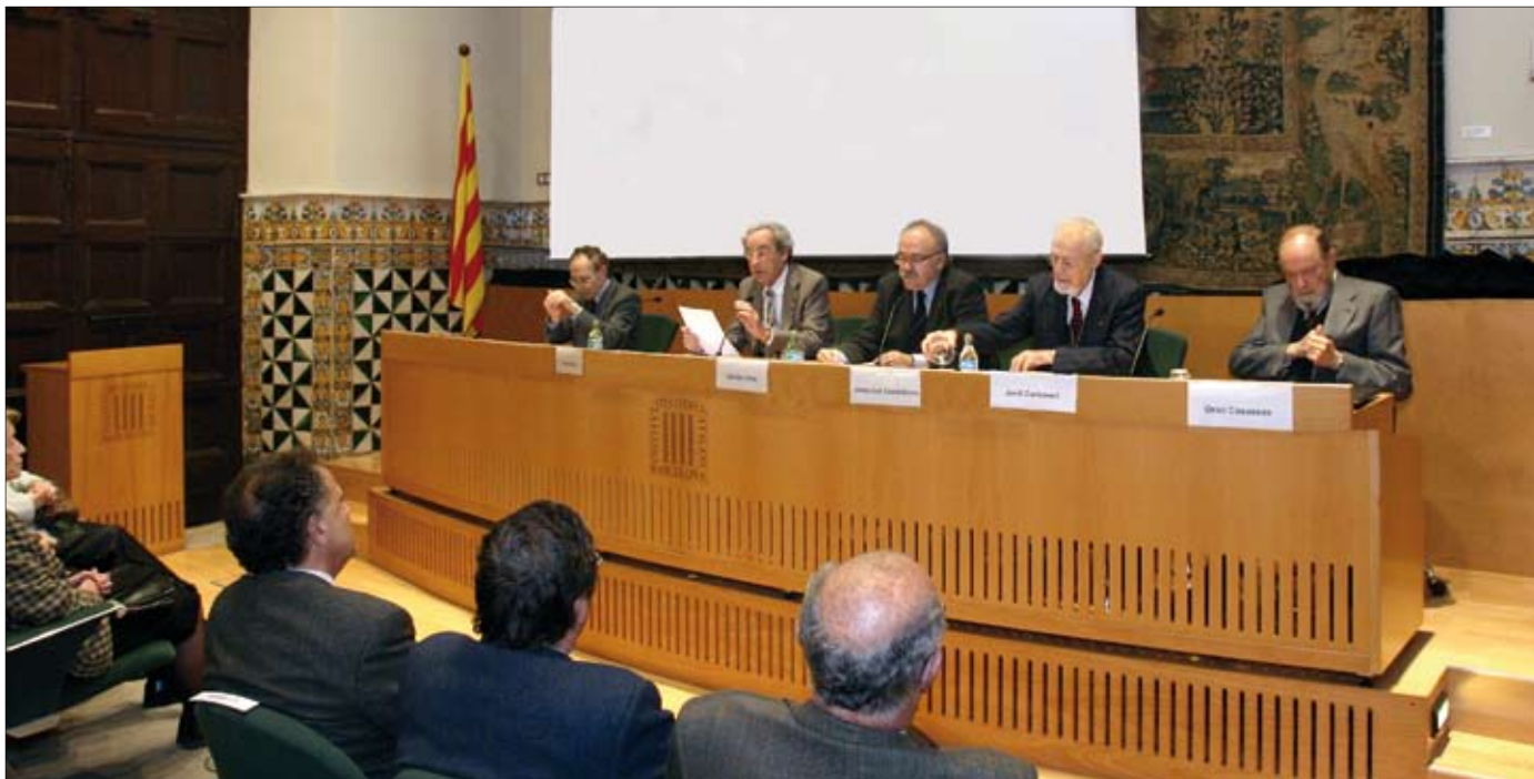
Presidència de la primera de les tres Jornades d'Homenatge a R. Aramon i Serra, amb motiu del centenari de la seva naixença (13 -11-2007), a l'Institut d'Estudis Catalans.