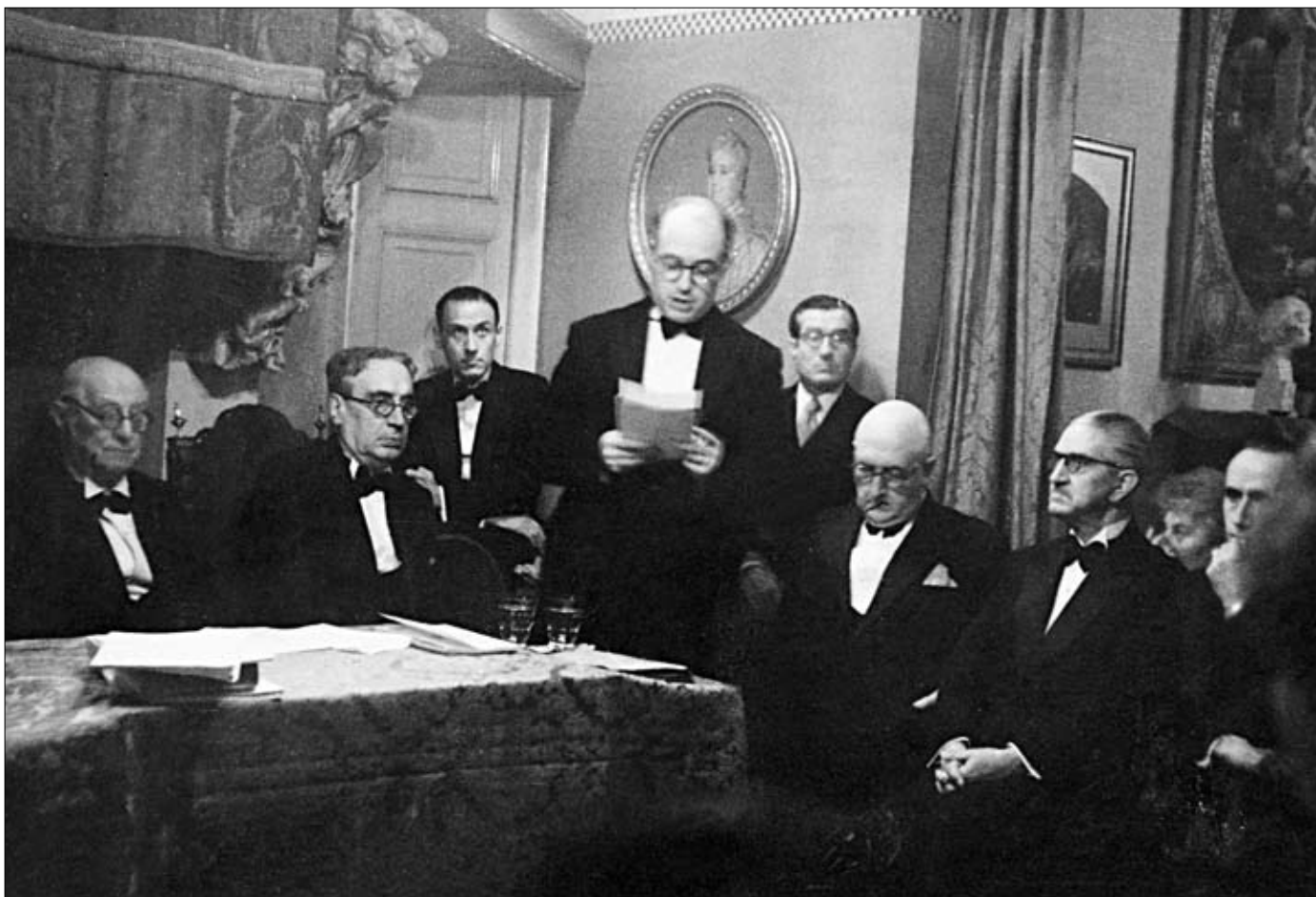
Festa anual de l'Institut d'Estudis Catalans, en 1949, a la llar de Josep Puig i Cadafalch.