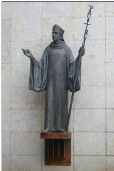
Escultura de l'abat Oliba, a Ripoll (obra de Francesc Fajula)

Els acords de Pau, que tenen un origen eclesiàstic i s'emparen jurídicament en les capitulars carolíngies, es localitzen en el Migdia francès; sembla que el primer és el concili de Charroux