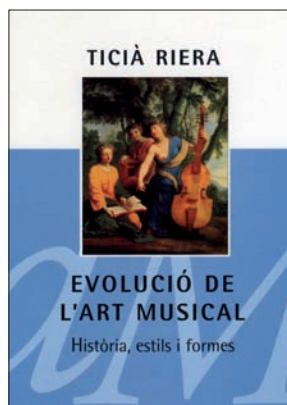
Ticià Riera, Evolució de l'art musical , Editorial Columna, Barcelona 2007.

E volució de l'art musical de Ticià Riera és un llibre de divulgació musical