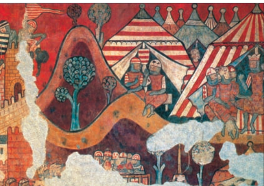
Setge de Mallorca per Jaume I (any 1229)

Els dos contrincants més forts, doncs, s'havien entès per menjar-se el més dèbil, Catalunya, la qual, davant el seu estat de prostració i de sotmetiment a les tropes castellanes, no tingué més remei que acceptar la nova situació. La fagocitació culminaria en la Guerra de Successió, amb la caiguda de Barcelona (1714) i, posteriorment, de Mallorca (1715), que havia ajudat els barcelonins amb homes i queviures durant l'heroica resistència de la ciutat comtal. L'aplica-