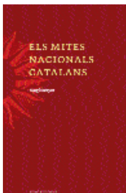
Magí Sunyer, Els mites nacionals catalans [pròleg de Pere Anguera], Eumo, Vic 2006.

Ens troben davant una obra necessària, perquè els mites –malgrat una línia d'opinió política i intel·lectual «cosmopolita» i retòricament progressista– són un factor angular d'identificació de qualsevol