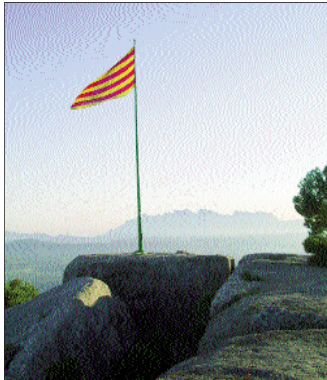
La bandera catalana a Collbaix (Bages), amb Montserrat al fons.

El «complex ideològic espanyolista» és, per damunt de tot, una veritable xarxa de complicitats , les complicitats