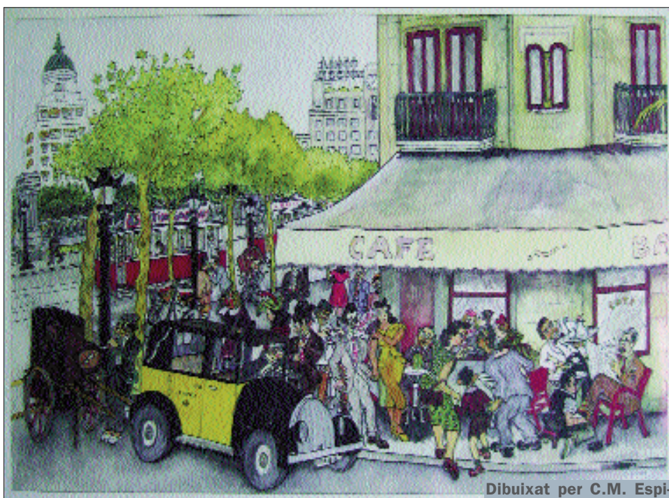
Dibuixat per C.M. Espi-

Però el nostre psicòleg no es queda solament amb el tema del cognom, i sentència: «En una altra mena d'ús i adequació del llenguatge hi ha un primordial secret de la nova educació.» Està convençut que sense enfortir l'expressivitat mancarem de personalitat i fins i tot ens dominaran les màquines. No es tracta de mirar enrere, però la força de la tecnologia «reclama la creació d'una nova filosofia que contesti els interrogants que ella, la tècnica, ha