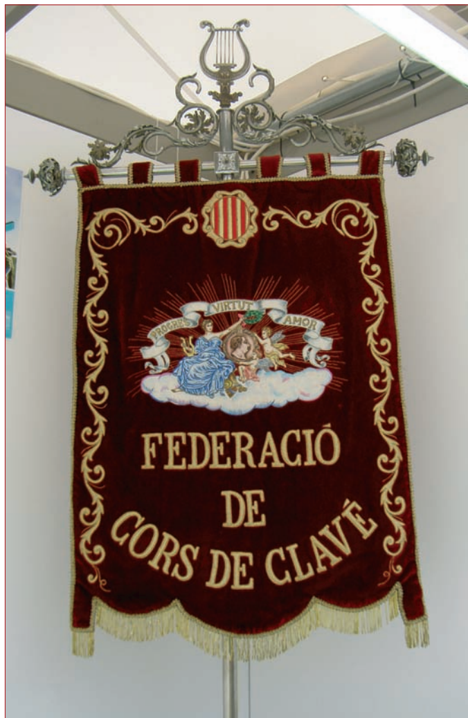
Estandard de la Federació de Cors de Clavé