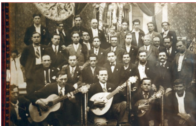
La Perla Agustinenca (dins els Cors de Clavé), any 1930

Un mateix idioma, és clar, però un registre radicalment diferent i desconegut, fins aleshores, per a aquells homes d'extracció humil.