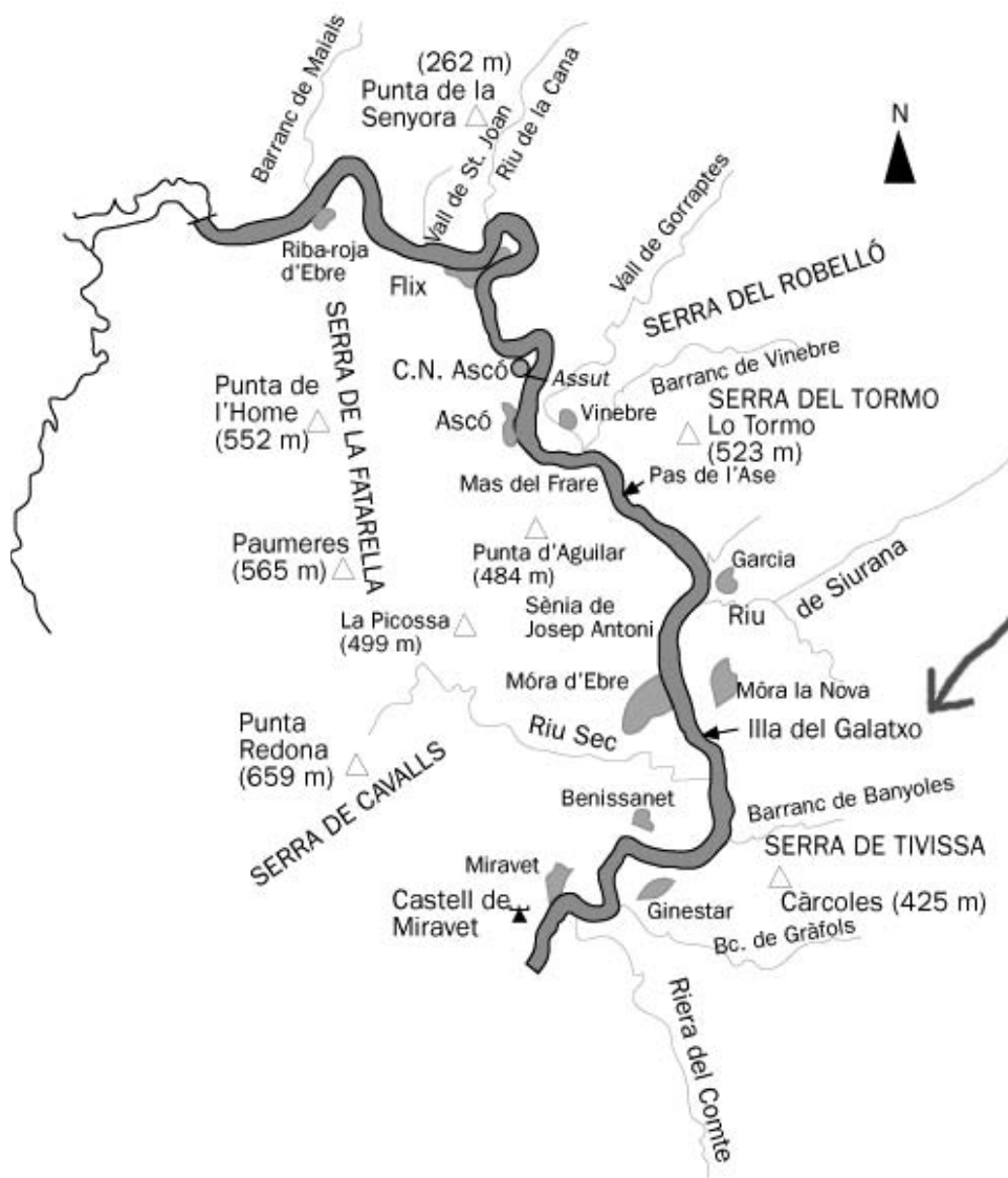
L'illa del Galatxo, en el riu Ebre, en el seu pas entre Móra d'Ebre i Móra la Nova

A la regió de l'Ebre, de Flix en avall, coneixen generalment amb l'arabisme galatxo els braços secundaris que de vegades presenta el riu, això és, l'Ebre. Galatxo és un nom comú en aquelles contrades (tal com van contrastar els Coromines pare i fill en la coneguda excursió que feren plegats navegant pel riu) i ha esdevingut també un topònim (enregistrat en cinc o sis casos, en l' Atles topogràfic de Catalunya ). Entre aquests topònims tenim, per exemple, l'illa del Galatxo, entre Móra d'Ebre i Móra la Nova —en què es veu clarament