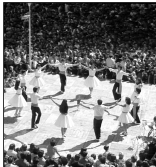
Sardana de lluïment (Pl. de St. Jaume, BCN)

el desgavell urbanístic i especulatiu que, des de la conurbació barcelonina, s'escampa com una taca d'oli pel territori català, ara compartimentat en «corones metropolitanes», com en la realitat cultural, perseguida amb insistència pel franquisme, de la creixent desconexió entre una Barcelona ostensiblement anacional i el seu país, Catalunya, que continua donant mostres de sana catalanitat. Pel que fa al primer aspecte, podem veure-hi un esgarrifós correlat de què representa el fenomen de la globalització a escala lo-