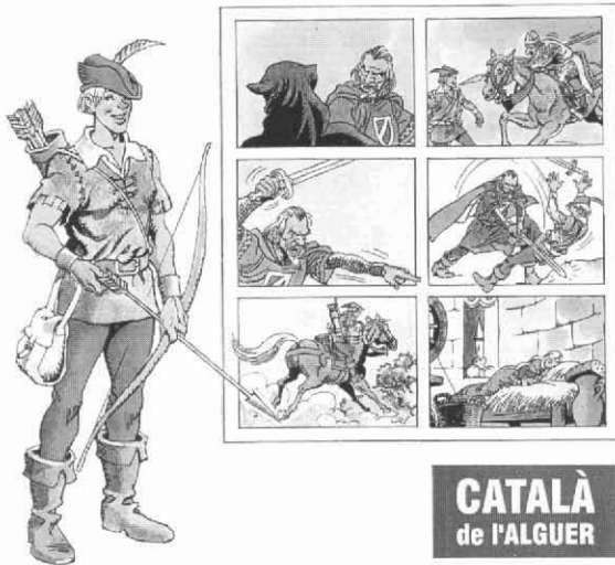
Portades dels llibres editats per Òmnium Cultural de l'Alguer Pinocchio i Robin Hood, escrits en català de l'Alguer

Aquest primer grup de joves, «creixint creixint», avui se diu Grup Arboix. Los components tenen ja una formació que s'està ulteriorment (3) especialitzant en diverses competències. Tots havem participat a cursos d'immersió lingüística i seminaris de l'universitat de Prada i cada u ha aprofundit la sua preparació seguint cursos diferents a nivell universitari. Tot això per poder activar servicis oberts a la població (4) algueresa.