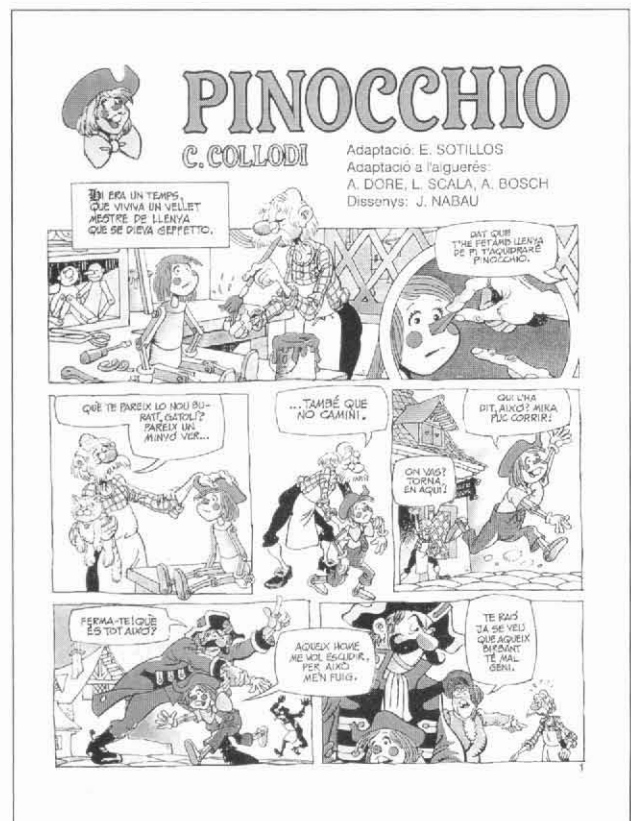
Pàgina del llibre Pinocchio. Si disposeu d'Internet, podeu llegir la resta del conte en la pàgina www.ipsia-alghero.org/fumetti/page.htm

En aquest clima d'obertura la nostra esperança més gran és de arribar a una major col·laboració entre les diverses associacions culturals alguereses perquè unint les forces s'arribi a resultats més incisivos i a fer conèixer la nostra realitat i peculiaritat en àmbits sempre més grans.