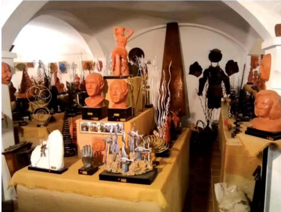
Taller museu de Miquel Morera i Darbra